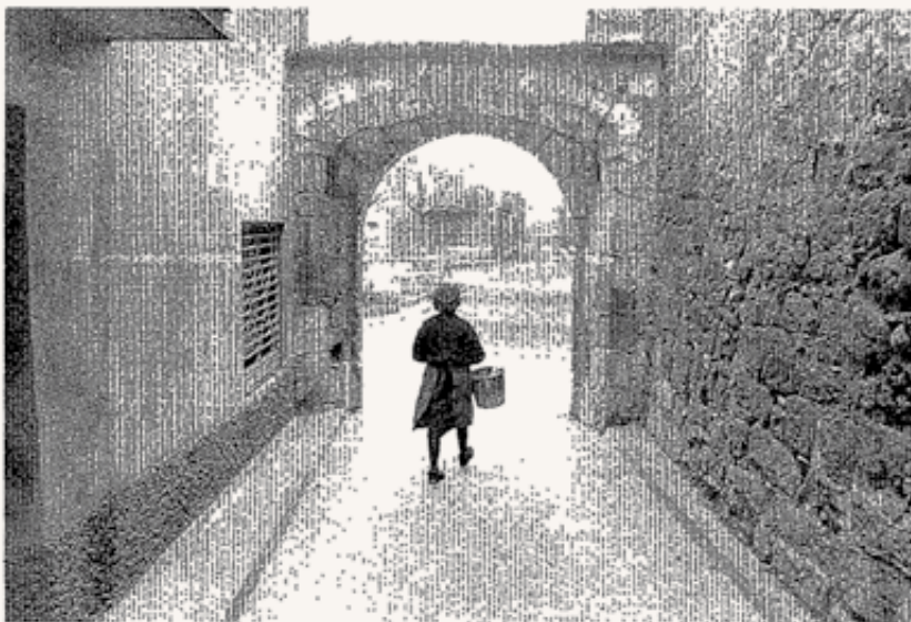
Una vecina de Tiurana pasea por una de las estrechas y solitarias calles del pueblo

Las fuentes oficiales de la confederación son tajantes. El miércoles y el jueves, el plazo para abandonar casas y haciendas habrá concluido,