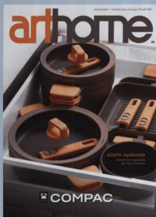
Esta edición de la revista arthome corresponde a: Arte Regalo 300 y Textiles para el Hogar 340